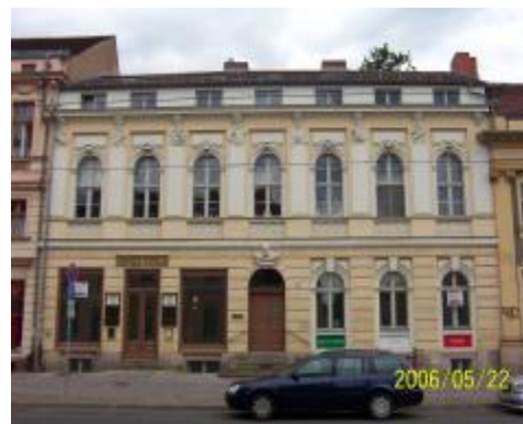
Ansicht des schon renovierten Nachbargebäudes

Ihren Namen erhielt der Straßenzug am 25.10.1820 nach der Prinzessin Charlotte von Preußen (siehe unten). Ursprünglich hieß diese Straße Pflugstrasse, genannt nach einem verdienten Unteroffizier Pflug, der später das Grundstück Nr. 36 erhielt.