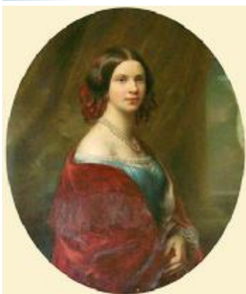
Friederike Charlotte Wilhelmine von Preussen; Grossfürstin Alexandra Feodorowna, Frau des Russischen Zaren Nikolaus I, Namensgeberin für die Charlottenstrasse.

Ihr BlickPunkt wird Sie natürlich über den weiteren Verlauf des Projektes unterrichten.