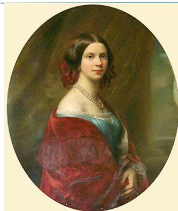
Friederike Charlotte Wilhelmine von Preussen; Grossfürstin Alexandra Feodorowna, Frau des Russischen Zaren Nikolaus I, Namensgeberin für die Charlottenstrasse in Potsdam.

Ein historischen Leckerbissen ist das hinter dem Gebäude liegende Fachwerkhaus - siehe nebenstehende Zeichnung und Beschreibung. Um so größer war die Herausforderung, dieses Kleinod harmonisch in die Gesamtkonzeption einzubinden, gleichzeitig den historischen Charakter zu erhalten und modernsten Wohnkomfort zu gewährleisten.