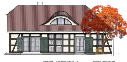
POTSDAM CHARLOTTENSTR. 12 REMISE OSTANSICHT