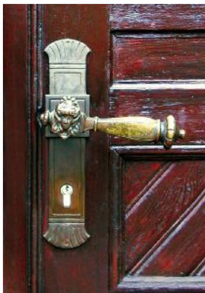
Treten Sie ein in die Immobilienwelt von THAMM & PARTNER

Sie können den BLICKPUNKT auf verschiedene Arten beziehen. Wir stellen Ihnen den BLICKPUNKT im Internet als PDF-File zur Verfügung. Sie können ihn als Newsletter per eMail oder klassisch per gelbe Post beziehen. In jedem Fall freuen wir uns sehr über Ihr Interesse.