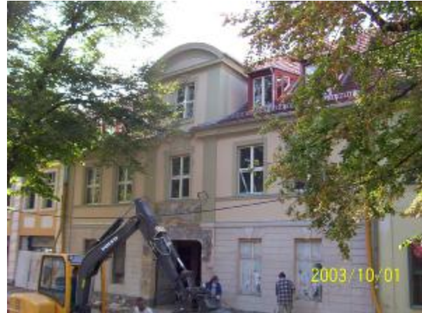
Dortustrasse 13 in Potsdam Der weisse Schwan ist allerdings noch zur Erholung beim Restaurator