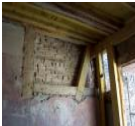
Ein sanierter Fachwerkwandbereich

Die betroffene Ausfachung der Fachwerkwand wurde entfernt und die durch Hauschwamm befallenen Fachwerkhölzer wurden erneuert. An den angrenzenden Wandbereichen ist eine fachgerechte Schwammsanierung durchgeführt worden. Die Ausfachung wird im Anschluss neu hergestellt.