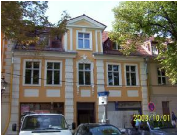
Dortustrasse 14 in Potsdam Die Gerüste sind endlich entfernt Ende November ist Richtfest